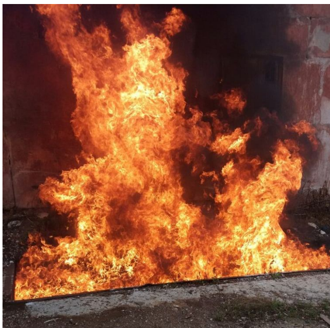
Рисунок 1 – Горіння макетного вогнища

Враховавши всі властивості вогнегасних речовин, ТОВ «Науково-виробниче підприємство «Вогнеборець» розробило новий водопінний вогнегасник ВВП-9(з). Його характеристики говорять самі за себе: гасить пожежі у вигляді модельних вогнищ класу 4А та 144В. Зокрема вогнегасник гасить ванну для легкозаймистих речовин та горючих речовин площею 10 м 2 заповнену бензином А-92 (рис. 1).