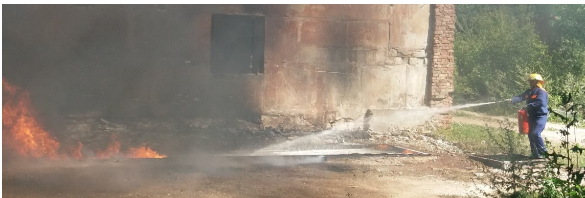
Рисунок 4 – Гасіння макетного вогнища площею 10 м 2 , вогнегасником водопінним ВВП-9(з) із зарядом «БАРС АFFF-1» з добавками