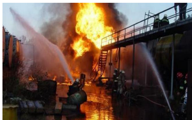
Рисунок 1 – Пожежа на Львівській нафтобазі "Плугова-1"

Машиніст локомотива залишив місце події. Працівники нафтобазі та члени добровільної пожежної дружини, діючи згідно з Планом ліквідації аварійних ситуацій (ПЛАС), почали гасіння пожежі і оперативно викликали усі необхідні служби.