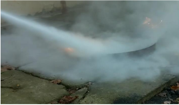
Рисунок 4 – Гасіння модельного вогнища 21В порошком КМ-2

Наступний дослід – це гасіння комбінованої пожежі з ВП-50 зарядженим порошком №4.