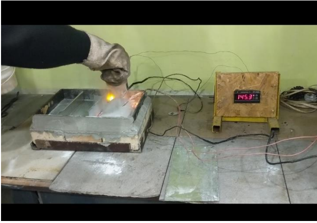
Рисунок 2 – Випробування вогнегасного порошку різної рецептури в лабораторних умовах

Очищаємо випробувальну шафу від твердих залишків магнієвих сплавів. Інтенсивність подавання вогнегасного порошку визначаємо з формули 1.