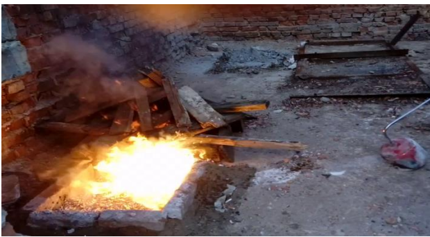
Рисунок 5 – Комбінована пожежа магнію і деревини

Наступний дослід – це гасіння комбінованої пожежі з ВП-50 зарядженим порошком №4.