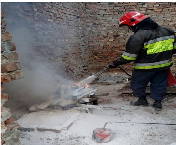
Рисунок 6 – Гасіння комбінованої пожежі деревини і магнію після подавання порошку піною підвищеної стійкості

Готуємо макетну пожежу горіння магнію, дерев'яних ящиків та бензину рис.5. За легендою горить запалювальна граната начинена магнієм біля складів з боєприпасами, або горить магнієва стружка в цеху і горіння розповсюдилось на дерев'яні, та картонні ящики з запчастинами. Спочатку подаємо вогнегасний порошок, а потім накриваємо піною підвищеної стійкості (рис.6).