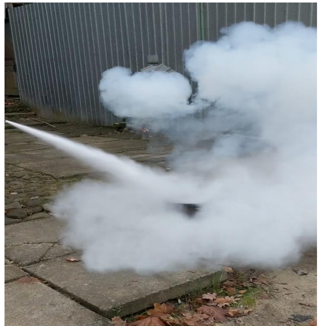
Рисунок 3 – Гасіння макетної пожежі класу В вогнегасним порошком КМ-2

Остаточні випробування проводимо за методикою відповідно ДСТУ 3675-98, як для вогнегасника ВП-2. Модельне вогнище представляє собою кругле деко діаметром 0,72 \text{ м}^2 відповідно до ДСТУ, в яке заливаємо 21 літр рідини, з них 1/3 вода 2/3 пальне марки А-92, тобто 14 літрів бензину. Для виготовлення порошку використовуємо рецептуру №4. Дослід виконуємо 3 рази оскільки за другим разом вогонь не був загашений.