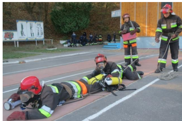
Рисунок 3 – Порядок пересування в колекторі командира ланки ГДЗС та газодимозахисника №1

колектора): 1) яким чином буде використовуватись дихальний апарат на стисненому повітрі традиційно на спині чи іншим чином (брати перед собою та просувати вперед та ін.); 2) спосіб пересування (навкарачки чи по-пластунськи). Після того, як командир ланки ГДЗС прийняв рішення про використання дихального апарата на стисненому повітрі, способу пересування (в нашому випадку по-пластунськи) доводить завдання та план дій до газодимозахисників далі дає команду «Апарати перевірити!». Після виконання оперативної перевірки ланка ГДЗС під наглядом керівника заняття приступає до виконання поставленого завдання газодимозахисник №1 встає за командиром ланки ГДЗС, а газодимозахисник № 2 під'єднує через карабіни, які закріплені на пожежних поясах, страхувальну мотузку, яку одним кінцем закріплює за пожежний пояс командира ланки (газодимозахисник №1 пропускає мотузку через карабін), а іншим за будь-яку зовнішню жорстку конструкцію. Постовий на посту безпеки (перевіряє зв'язок, записує вихідні дані у журнал постового ПБ). Командир ланки ГДЗС вмикає ліхтар та дає команду «До входження в колектор готуйся». За цією командою командир ланки ГДЗС та газодимозахисник №1 перед входом в колектор приймають положення лежачи, далі командир ланки ГДЗС передає свій апарат газодимозахиснику №1, який буде виконувати функцію транспортування двох апаратів (свого та командира) до місця роботи в обмеженому просторі, після чого командир ланки дає команду «За мною руш», як на рисунку 3 [9].