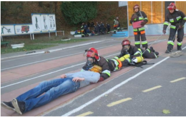
Рисунок 4 – Транспортування постраждалого командиром ланки ГДЗС

Відпрацювання рятувальних операцій в цих умовах вимагає від газодимозахисників відмінної фізичної підготовки та психологічної витримки, а також взаєморозуміння між командиром ланки ГДЗС та газодимозахисником №1, які працюють разом в обмеженому просторі. В окремих, непередбачених ситуаціях, газодимозахиснику необхідно прийняти нештатне, але єдине правильне рішення вибору способу підготовки та транспортування постраждалого. Кожен газодимозахисник повинен досконало володіти різними способами евакуації постраждалого, а також навиками виготовлення допоміжних засобів транспортування з підручних засобів. Незнання чи вибір неправильних засобів транспортування постраждалого може призвести до погіршення стану постраждалого, аж до загрози летального випадку.