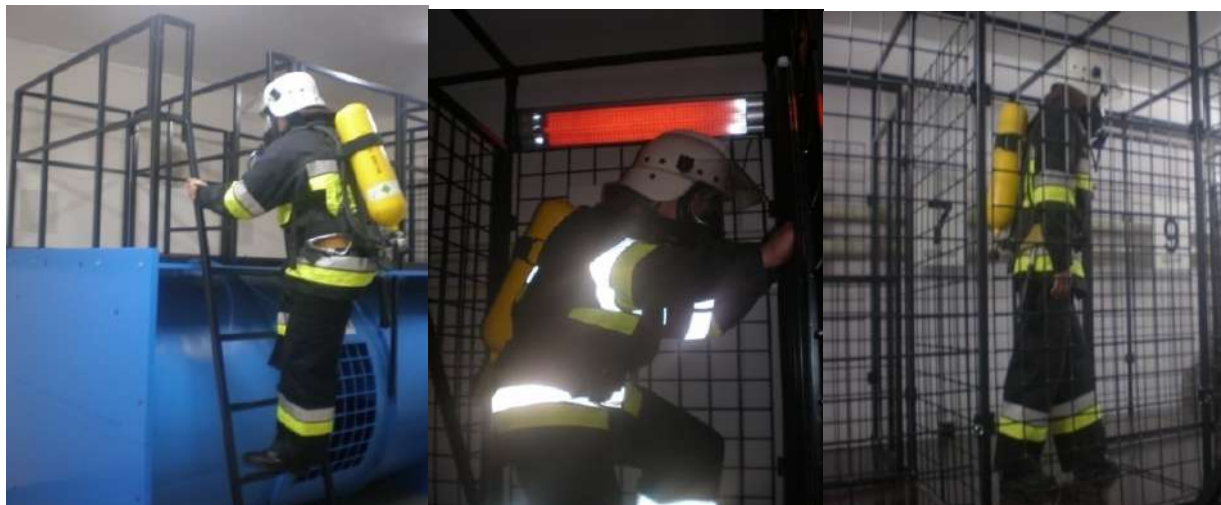
Рисунок 4 – Проходження тренувальної стежки газодимозахисником

Резервуар призначений для проведення аварійно-рятувальних робіт і рятування людей з резервуарів та спеціальних посудин.