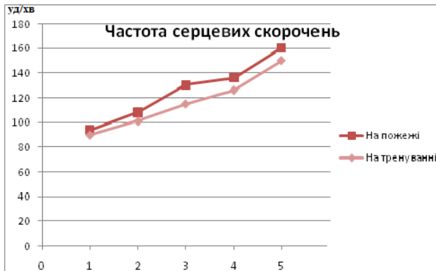
Рисунок 1 – Залежність зміни ЧСС газодимозахисників від збільшення навантажень на пожежі та на тренуванні