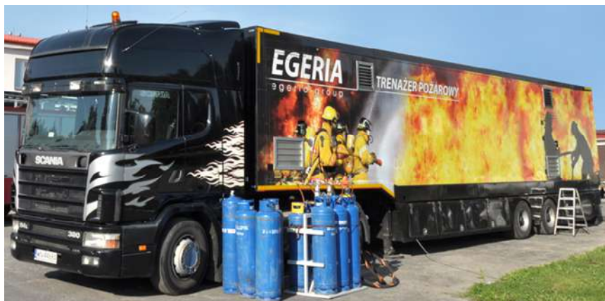
Рисунок 3 – Вогневий тренажер ML 2000

Вогневий тренажер ML 2000 – це мобільний фургон, що розміщений на напівпричепі (рис. 3), з розмірами 12×2,5×2,4 м, об'ємом 72 м 3 . Враховуючи те, що фургон є розкладним та вміщує допоміжні приміщення (операторна, димогенераторна тощо) внутрішній об'єм самої вогневої кімнати становить близько 65 м 3 . Мобільний тренувальний комплекс обладнаний тисячами температурних датчиків, сучасною електронікою та комп'ютерним управлінням, що робить його абсолютно безпечним для газодимозахисників та навколишнього середовища.