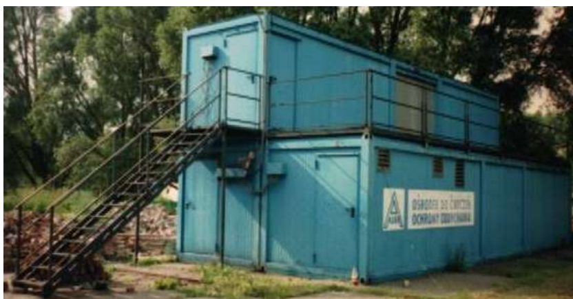
Рисунок 5 – Загальний вигляд ТДК контейнерного типу

Тренувальні полігони (ТДК) контейнерного типу є стаціонарними (рис. 5).