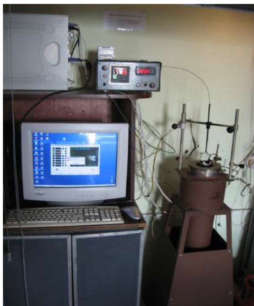
Рисунок 1 – Пристрій ОТП, ПК, термоперетворювач ТХА – хромель-алюмель

Прилади і методи. У ході проведення досліджень використано лабораторні ваги ТВЕ 150, прилад ОТП, секундомір лабораторний. Температуру займання визначали за допомогою термоперетворювача ТХА – хромель-алюмель згідно з ДСТУ Б В.2.7-19-95, а час до займання – секундоміром від початку дослідження температури займання до моменту займання.