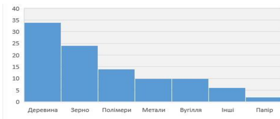
Рисунок 1 —Розподіл рівня небезпеки вибуху за матеріалом пилу [3]

Згідно із статистичними даними [3], 80% усіх промислових пилів є горючими а їх відсотковий розподіл за видами матеріалів та речовинами вказаний на рис.1. Як видно із статистичних даних [3], з усіх видів вибухів пилу, вибухи зернового, деревного, синтетичного та вугільного пилу вважаються найбільш небезпечними. Відомо, що близько 30 % усіх вибухів пов'язані з зерном та іншою сільськогосподарською продукцією. В будь-який час при кожному переміщенні, обробленні чи зберіганні зерна утворюється горючий пил. Повітря та джерела спалахування, наприклад нагріті поверхні чи статична електрика, неодмінно наявні в транспортному обладнанні, сушарках тощо. Сьогодні на території України щороку відбувається близько 10 первинних пилових вибухів на підприємствах зберігання та переробки зерна. [4].