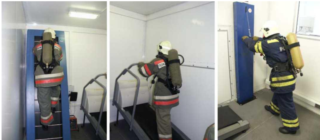
Рис. 3. Загальний вигляд тренажерів в теплокамері

Тренування в тепло камері здійснюється на тренажерах за круговим методом рис.3. Час та особливості виконання вправ повинні бути різними для кожної з медиковікових груп.