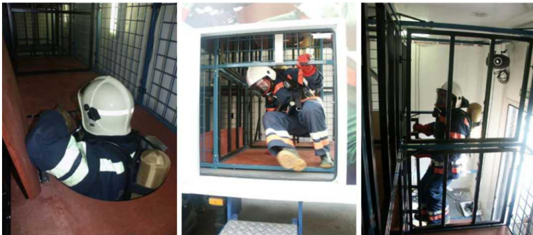
Рис. 2. Тренувальна стежка з рухомими перегородками

Для розширення можливостей вирішення тактичних задач з одночасним виконанням вправ, що імітують роботу на пожежах (аваріях), димокамеру обладнують тренувальною стежкою з рухомими перегородками рис.2.