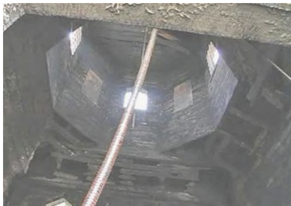
Рис. 3. Інтер'єр церкви після пожежі

Наслідки пожежі дерев'яної церкви з необробленою деревиною купольної частини Преподобної Параскеви в селі Климашівці на Хмельниччині, вік якої становив 227 років показано на рисунку 3.