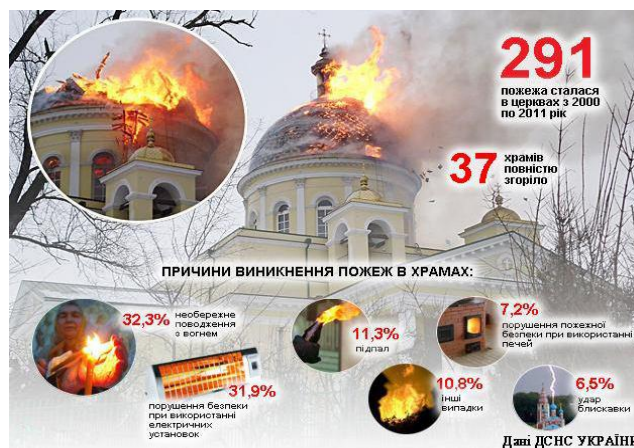
Рис. 2. Статистика пожеж у храмах України

На рисунку 2 наведена статистика найпоширеніших причин пожеж в храмах України за даними Державної служби України з надзвичайних ситуацій (ДСНС) [9].