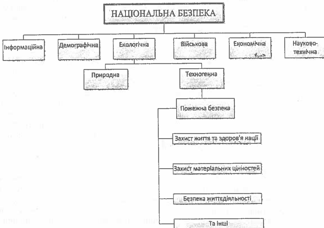
Рис. 1. Складові національної безпеки

ми та громадськими органами (організаціями), а також окремими особами під час виконання чи забезпечення виконання правил пожежної безпеки.