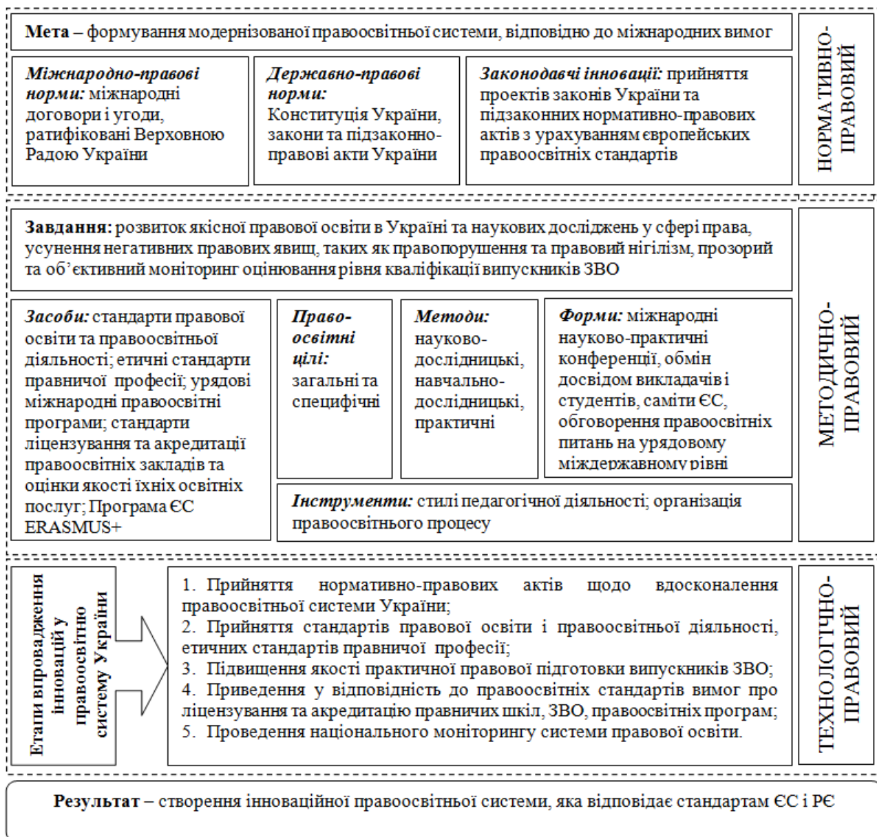
Рисунок 2 – Модель впровадження інновацій в правоосвітню систему України

Нормативно-правовий складник передбачає оновлення нормативної бази правоосвітньої системи, шляхом внесення змін і доповнень до норм чинного законодавства, його адаптацію до правових стандартів ЄС і РЕ, прийняття відповідних нормативно-правових актів що врегульовують питання підвищення якості правової освіти, зокрема, Закону України «Про юридичну (правничу) освіту і загальний доступ до правничої професії», «Концепцію вдосконалення правничої (юридичної) освіти для фахової підготовки правника відповідно до європейських стандартів вищої освіти та правничої професії» (на сьогодні вони є в проєктах, що потребують удосконалення).