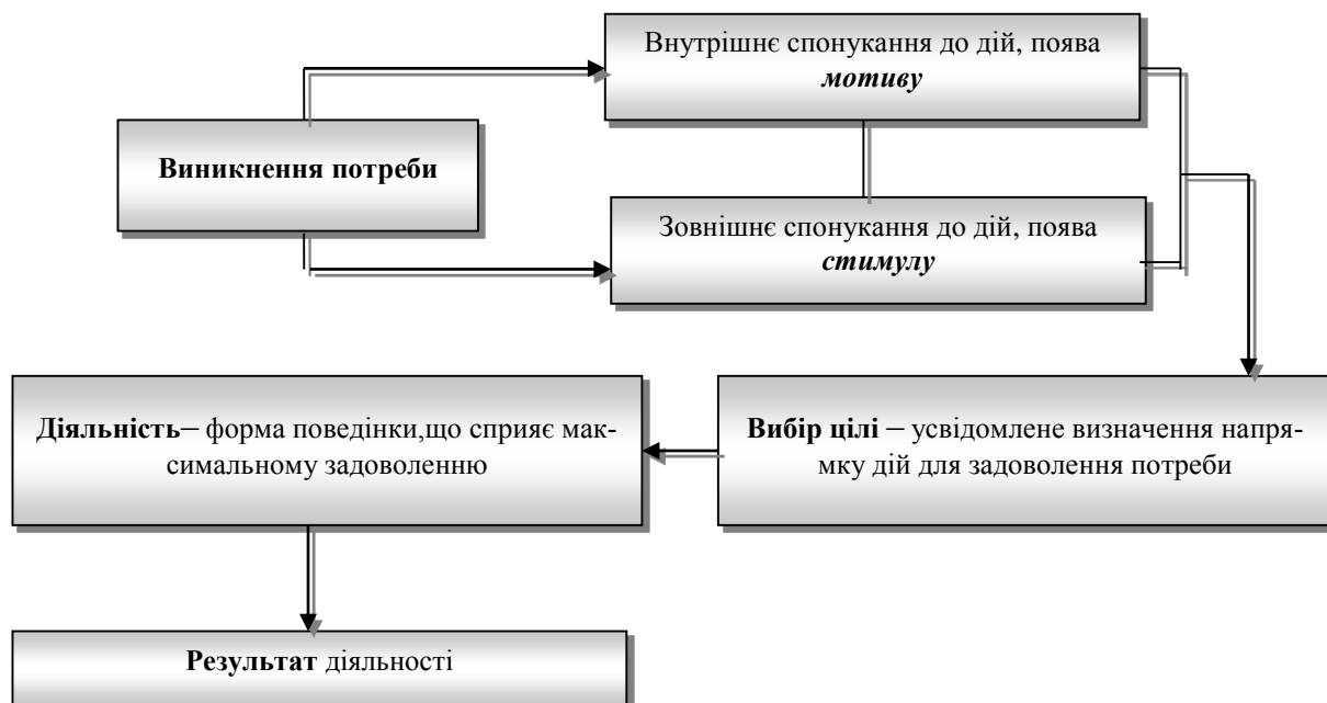
Рисунок 2 – Мотиваційні процеси.

Мотиваційні процеси – це внутрішні та зовнішні спонукання до дії, які визначаються потребами самовдосконалення та професійного зростання [4]. А це, в свою чергу, впливає на вибір цілей та діяльності фахівця-менеджера, що і визначає результат його діяльності (рис. 2).