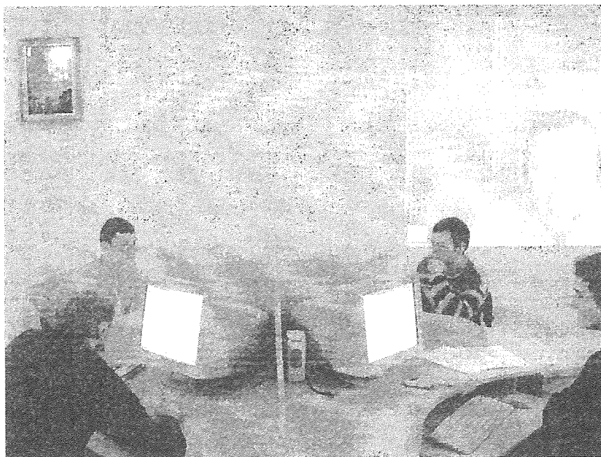
Рис. 2. Дистанційне заняття зі студентами денного навчання

Ще одним етапом впровадження комбінованого навчання у Львівському державному університеті безпеки життєдіяльності стала організація Віртуального університету (ВУ) (рис. 3) [15].