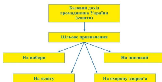
Рисунок 3 – Схема розподілу цільових коштів БДГУ

Додатковими джерелами формування коштів БДГУ можуть бути також: дивіденди державних підприємств України, скерованих до БДГУ; кошти державного бюджету, що спрямовуються до БДГУ у випадках, встановлених законом; процентні доходи від розміщення на рахунках уповноважених банків тимчасово вільних коштів БДГУ; благодійні внески підприємств, установ, організацій та громадян; кошти від усіх операцій та джерел, з яких формується БДГУ, спочатку акумулюються на єдиному консолідованому транзитному рахунку в Ощадному банку України і в останній робочий день тижня пропорційно розподіляються на спеціальні рахунки громадян України для формування із них БДГУ; інші надходження відповідно до законодавства України. Кошти на вказаних рахунках комерційних банків гарантуються Фондом гарантування вкладів фізичних осіб незалежно від їх розміру; інші надходження відповідно до законодавства України. Кошти базового доходу громадянина України використовуються виключно за цільовим призначенням і рівномірно розподіляються для отримувача виключно на: