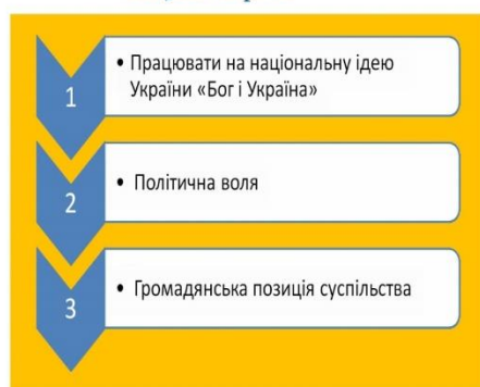
Рисунок 8 – Графічне зображення чинників для можливого запровадження БДГУ

Перспективою подальших досліджень тематики базового доходу громадянина України вба-