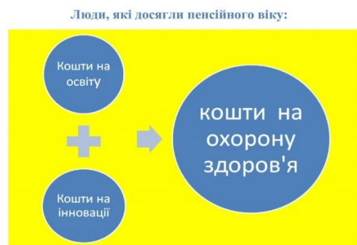
Рисунок 6 – Схема можливого перепризначення коштів для пенсіонерів

Перераховані джерела наповнення БДГУ відповідають: