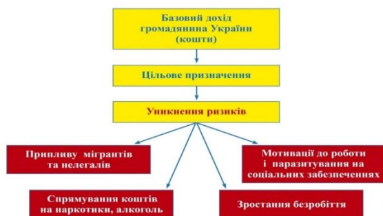
Рисунок 4 – Схема уникнення ризиків за умов прийняття БДГУ

– фінансування виборчого процесу ( фінансування кандидатів на посаду сільського, міського голів, кандидатів у депутати до органів місцевого самоврядування і Верховної Ради України ).