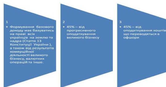
Рисунок 2– Схема формування надходжень для прийняття БДГУ

Додатковими джерелами формування коштів БДГУ можуть бути також: дивіденди державних підприємств України, скерованих до БДГУ; кошти державного бюджету, що спрямовуються до БДГУ у випадках, встановлених законом; процентні доходи від розміщення на рахунках уповноважених банків тимчасово вільних коштів БДГУ; благодійні внески підприємств, установ, організацій та громадян; кошти від усіх операцій та джерел, з яких формується БДГУ, спочатку акумулюються на єдиному консолідованому транзитному рахунку в Ощадному банку України і в останній робочий день тижня пропорційно розподіляються на спеціальні рахунки громадян України для формування із них БДГУ; інші надходження відповідно до законодавства України. Кошти на вказаних рахунках комерційних банків гарантуються Фондом гарантування вкладів фізичних осіб незалежно від їх розміру; інші надходження відповідно до законодавства України. Кошти базового доходу громадянина України використовуються виключно за цільовим призначенням і рівномірно розподіляються для отримувача виключно на: