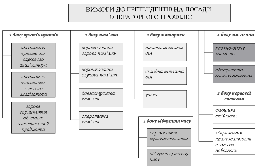
Рис. 2. Вимоги до претендентів на посади операторного профілю

Коли людина звертається до інформаційної моделі, в її свідомості на основі накопичених знань і досвіду формується внутрішня концептуальна модель – сукупність уявлень і суб’єктивне віддзеркалення в свідомості людини інформації про стан об’єкта управління і зовнішнього виробничого середовища. Саме концептуальна модель визначає характер рішень і управляючих дій людини-оператора на технічний об’єкт. Інформаційна модель є джерелом і основою для формування концептуальної моделі.