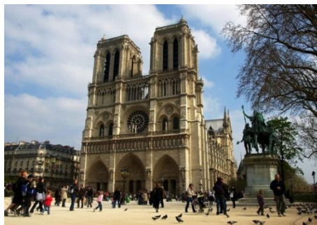
Рисунок 1 — Собор Нотр-Дам де Парі