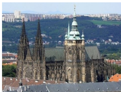
Рисунок 2 — Кафедральний собор святого Віта, Вацлава, Войтехы в Празі