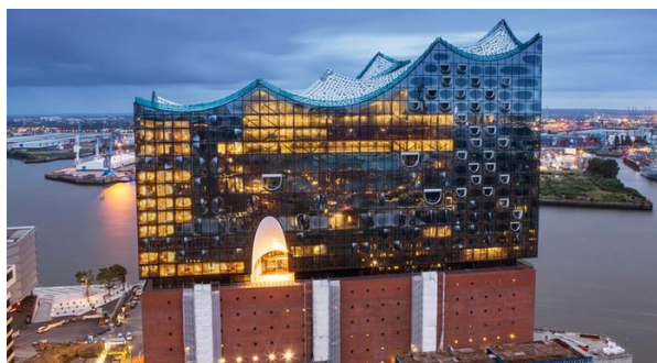
Рисунок 3 — Філармонія на Ельбі — пам'ятник проектно-управлінської безпорадності і новий символ Гамбурга

Але хто з цього приводу шкодуватиме? Філармонія постала на одному з островів, який раніше був забудований лише величезними коморами гамбурзького порту, і гармонійно поєднала в оригінальне ціле старе портове сховище і нову футуристичну скляну надбудову. Спочатку — мега-довгобуд та мега-витратна споруда, а тепер — новий культурний (!) символ звично торгового (!) Гамбурга та ще й перлина світової архітектури. Концертні зали — велика на 2100 місць і мала на 500 місць — розташовані в будівлі там, куди не проникнути шумові з порту. Та ще й будівельні конструкції спираються на ресорні пристрої. На жодному місці слухач не опиниться на відстані понад 30 метрів від диригента. Скляний мистецький витвір у вигляді хвиль, що сягає 110 метрів у висоту, розробили архітектори зі швейцарської компанії Herzog & de Meuron.