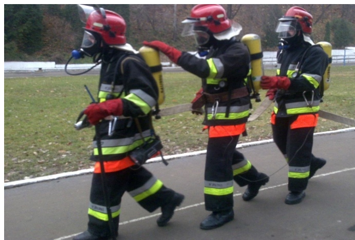
Рис.1.3. Пересування ланки ГДЗС по горизонтальній поверхні

Другий етап – експеримент з трьома ланками ГДЗС на горизонтальній поверхні протяжністю 66 м, (рис. 1.3). Знаємо, що ланка ГДЗС долає до реактора та від нього по 33 м. Ланки ГДЗС, які склались з 3-х чоловік, у захисному одязі зі спорядженням подолали цю дистанцію з видимістю більше 12 м в середньому за 1,31 хв. (табл. 1.1)