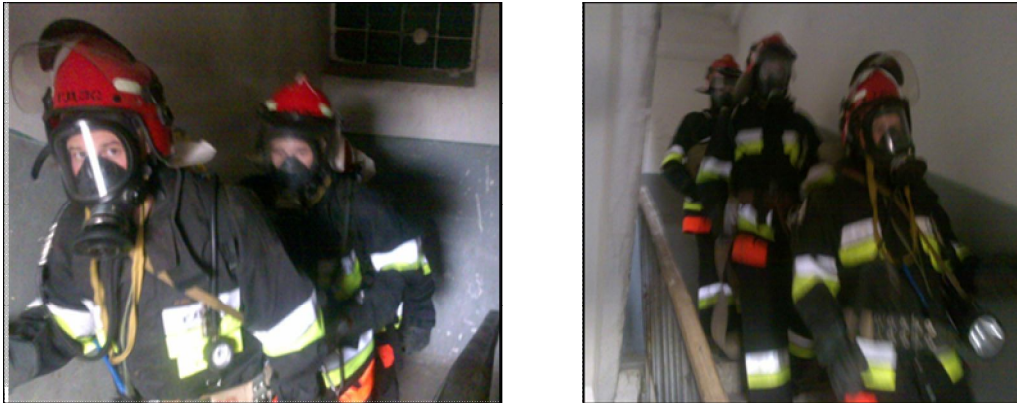
Рис. 1.2. Підйом та спуск сходовими маршами ланки ГДЗС

в не задимленому приміщенні з нормальною видимістю (більше 12 м) та без зовнішнього впливу високих температур на організм людини, що значно збільшує витрату повітря та зменшує швидкість руху ланки ГДЗС. Перша ланка ГДЗС підіймалась на висоту 48 м за 7,55 хв, а спуск відбувся за 5,57 хв, друга ланка ГДЗС підіймалась за 7,50 хв, спуск відбувся за 6,0 хв і третя ланка ГДЗС підіймалась за 7,52 хв спуск відбувся за 5,51 хв. Отже такий підйом сходовими маршами на висоту 48 м експериментально проведений кожною ланкою ГДЗС (рис. 1.2). Отже середнє значення часу підйому ланкою ГДЗС сходовими маршами до відмітки 48 м – 7,53 хв; час спуску – 5,56 хв.