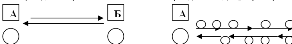
Рис. 1. Схеми пасажирських переміщень: а) переважаючі, б) роззосереджені

У 90-х роках минулого століття проблему транспортних перевезень вирішували спираючись на наявну тоді схему: значний потік пасажирів двічі на добу: зранку та після роботи.