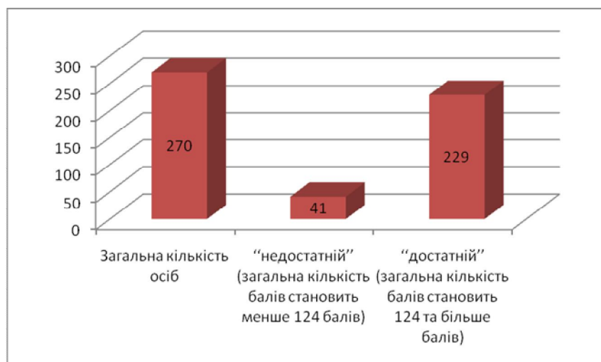
Рис. 1. Кількісна характеристика складання іспиту з фізичної підготовки абітурієнтами Львівського державного університету безпеки життєдіяльності набору 2010 р.

На рис.1 наведені кількісні показники складання абітурієнтами Львівського державного університету безпеки життєдіяльності іспиту з фізичної підготовки. Результати викладені на рис. 1.