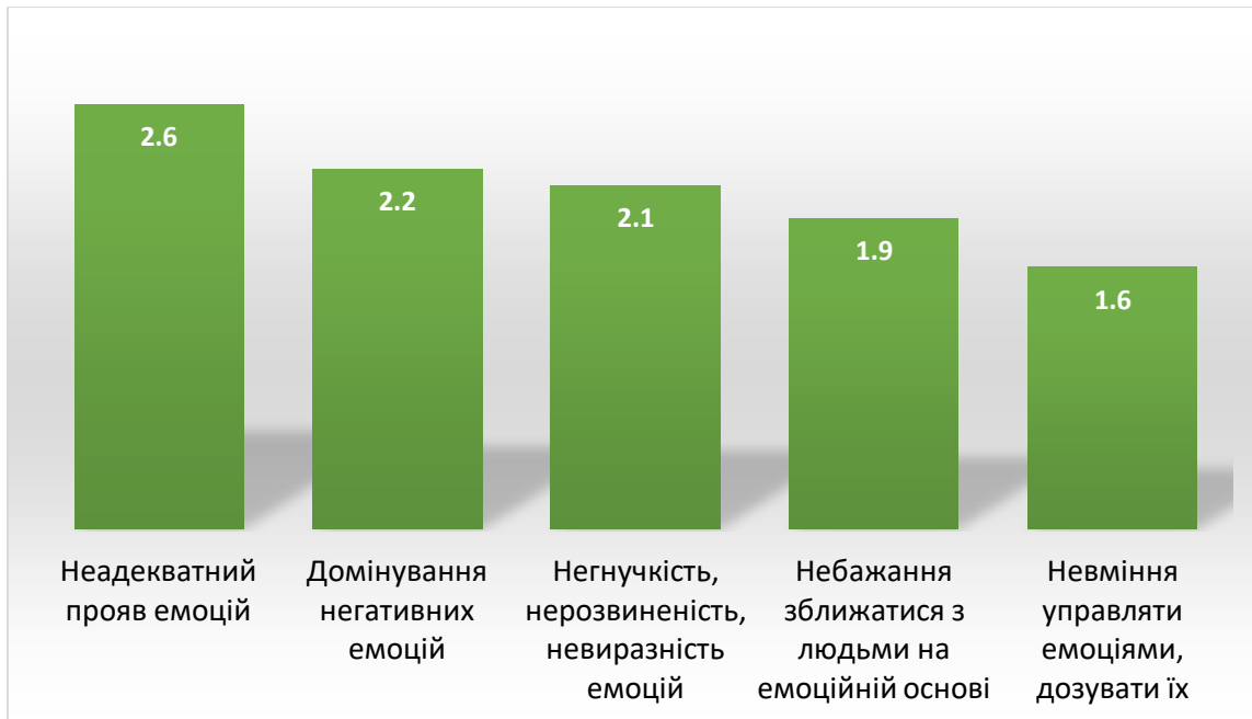
Рисунок 1 – Рівень прояву перешкод у встановленні емоційних контактів (середній бал)

перешкода «неадекватний прояв емоцій» (2,6), приблизно однаковою мірою – «домінування негативних емоцій» (2,2), «негнучкість, нерозвиненість, невиразність емоцій» (2,1) та «небажання зближатися з людьми на емоційній основі» (1,9), а найменш вираженим є «невміння управляти емоціями, дозувати їх» (1,6) (див. рис. 1).