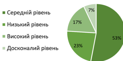
Рисунок 4 – Рівні компетентності в управлінні конфліктами

Отже, вважаємо, що майбутнім психологам слід удосконалювати навички управління конфліктами, формувати конфліктологічну компетентність, комунікативні установки.