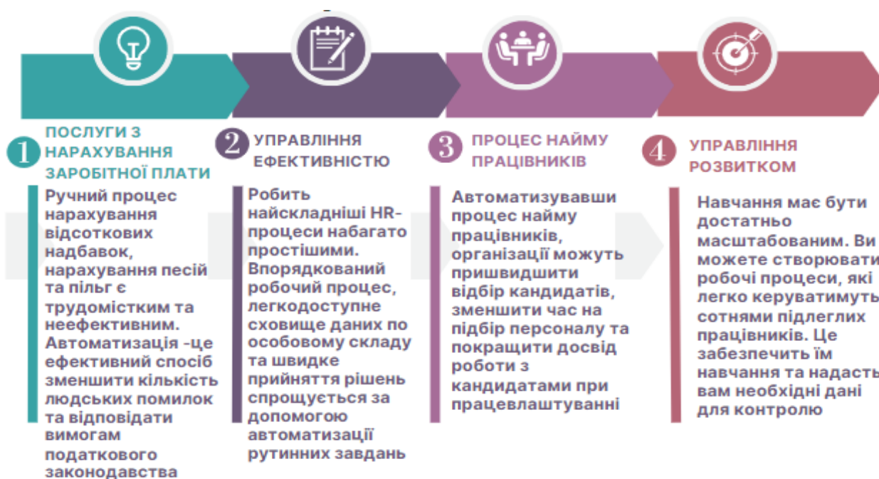
Рисунок 1 – Форми сфери управління персоналом

4. Управління змінами. Впроваджуючи автоматизацію управління персоналом, державним структурам доведеться ефективно керувати перехідним періодом, щоб мінімізувати перешкоди для державного сектора та співробітників. Не тільки команди HR-менеджменту потрібно буде адаптуватися до нового способу роботи, але й співробітникам знадобиться деякий час, щоб звикнути до того факту, що тепер є портал для пошуку інформації та запитів. На рисунку розглянемо конкретні сфери управління персоналом, які можна передати технологіям для автоматизації